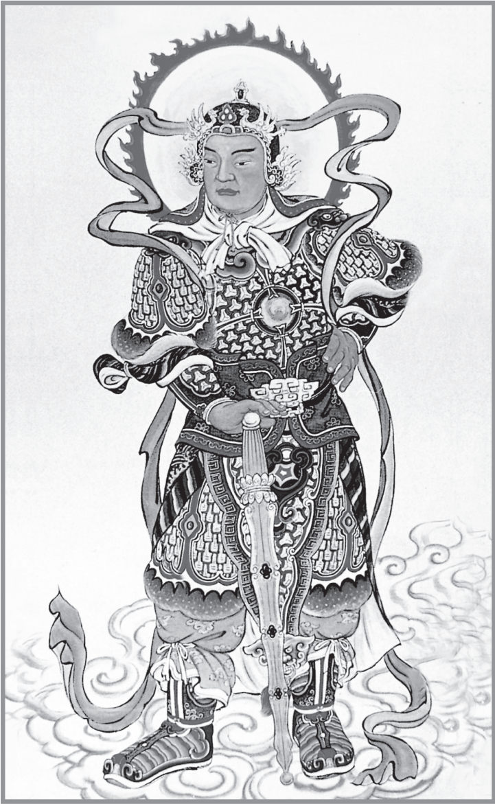
NAM MÔ HỘ PHÁP TẠNG BỒ TÁT